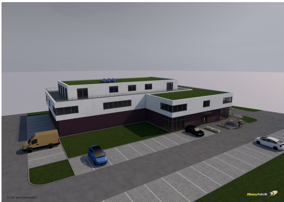
Schrägansicht aus Richtung Westen

Schrägansicht Ecke Ahrenloher Str./Kummerfelder Weg (aus Richtung Kreisverkehr kommend)