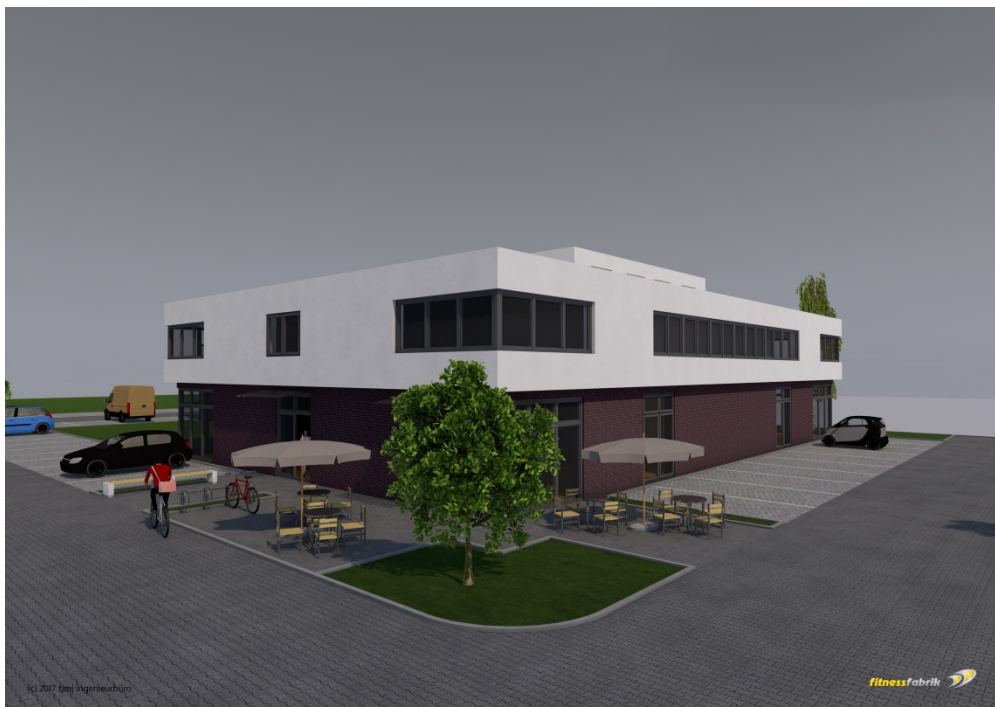
Schrägensicht von der Ahrenloher Str. (aus Richtung Ortskern kommend)

Es liegt ein erster Entwurf für das Gebäude des Fitnessstudios vor: Die Visualisierung zeigt ein Gebäude mit zwei Vollgeschossen und einem Staffelgeschoss mit Mauerwerksfassaden im Erdgeschoss, Putzfassaden in den oberen Geschossen und begrünten Flachdächern. Eine Anpassung an das im B-Planentwurf vorgesehene Baufenster ist noch erforderlich.