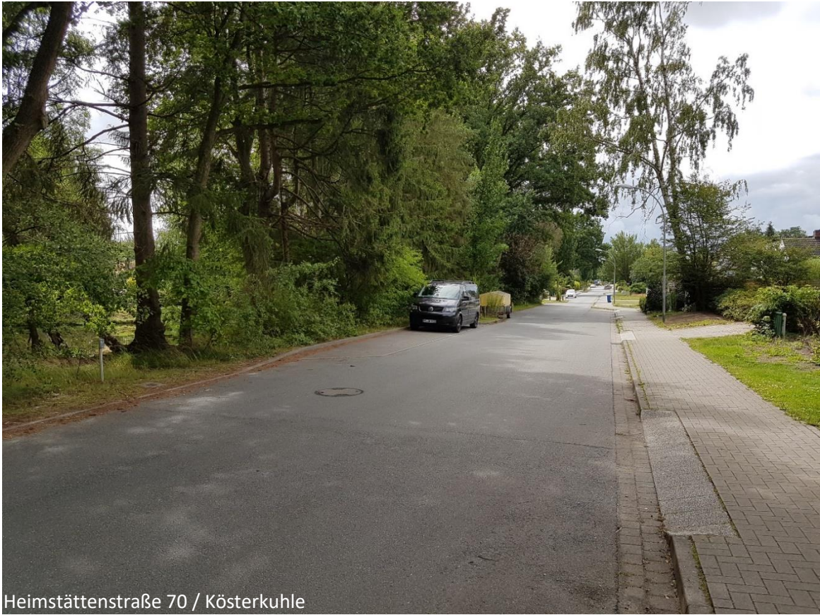
Heimstättenstraße 70 / Kösterkuhle